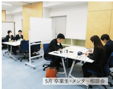
5月 卒業生・メンター相談会