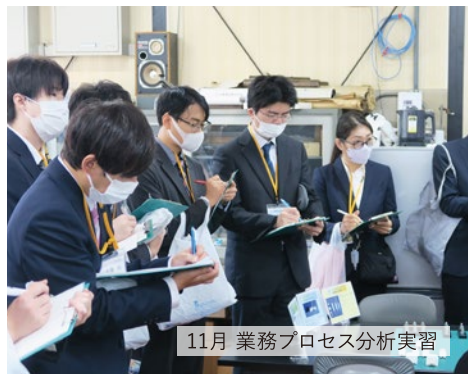
11月 業務プロセス分析実習