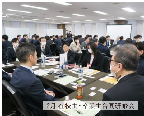
2月 在校生・卒業生合同研修会