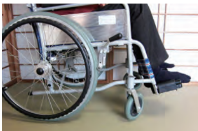
車椅子を使用しても沈み込みが少なく安心です

知的財産総合支援センター埼玉との連携で特許取得と商標登録を実施、埼玉県産業振興公社のICTアドバイザーとの連携で広報展開、東京都立産業技術研究センターとの連携で、性能試験や技術支援を複数の機関と連携したチーム支援として実施した。