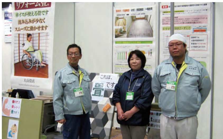
展示会出展も家族全員で力を合わせて