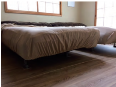
ベッドルームのリフォームに最適

畳床の「衝撃緩和性」と「ライフスタイルに合わせて自由に選択する表材のよさ」を合わせ持ち、車椅子が使える高機能畳。近年、高齢者介護が増える中、屋内転倒やベッドから移動する際の尻餅による衝撃での骨折で、寝たきりとなる例も多いが、その防止・軽減に貢献。